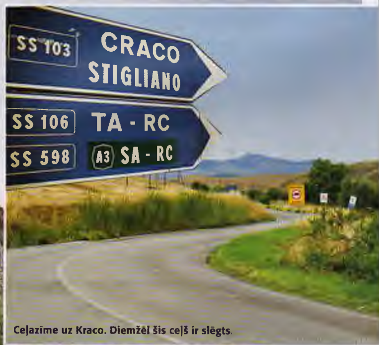
Ceļazīme uz Kraco. Diemžēl šis ceļš ir slēgts.

P ārsteidzoši, cik orgāniski pilsēta iekļaujas apkārtējā vidē, kaut gan aizsardzības nolūkos tā celta uz stāvas klints un no tālienes atgādina milzu skudru pūzni. Vēsturiskais centrs pamests kopš 1963. gada, kad pilsētas pēdējie iemītnieki tika izmitināti turpat netālu, jo vairākkārtējas zemestrīces bija iznīcinājušas mājokļus un padarījušas pilsētu bīstamu cilvēkiem. Tuvejā apkārtnē redzamas dažas saimniecības, taču grūti saprast, ar ko īsti mūsdienās nodarbojas atlikušie iedzīvotāji, bet kādreiz te plaukusi zemkopība un lopkopība. Pirmsākumos pilsēta dēvēta latīņu vārdā Grachum , kas būtu tulkojams aptuveni šādi: nesēn aparts lauks. Senākais rakstītais dokuments datēts ar 1060. gadu.