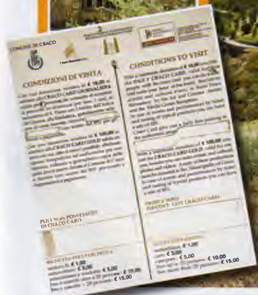
Cenas un noteikumi, kas jāievēro mirušās pilsētas apmeklētājiem.