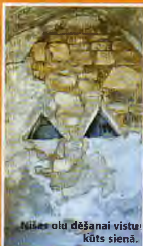
Mīlas olu dēšanai vistu kūts sienā.

Pa šo ielu var nokļūt līdz mirušās pilsētas vārtiem. Tiesa gan, to apmeklēt drīkst tikai dienas gaišajā laikā un gida pavadībā.